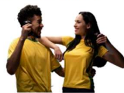
スポーツの後に！ おうちでのリラックスタイムに！